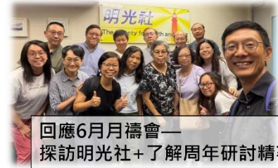
回應6月月禱會— 探訪明光社+了解周年研討精華(20/6)