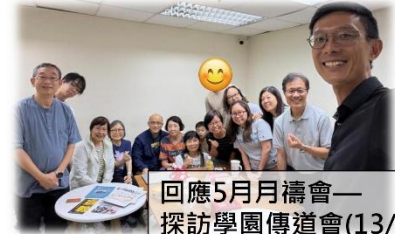
回應5月月禱會— 探訪學園傳道會(13/6)