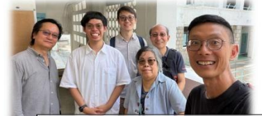
回應4月月禱會— 與神學生午飯相聚(12/5)