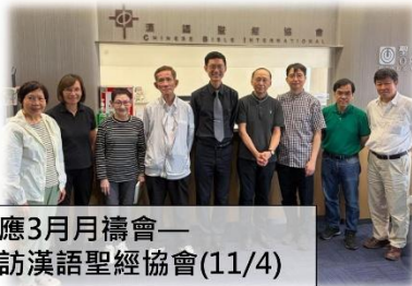
回應3月月禱會— 探訪漢語聖經協會(11/4)