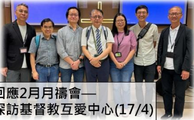
回應2月月禱會— 探訪基督教互愛中心(17/4)